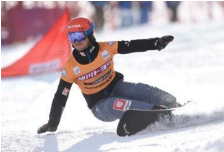
auf seiner Siegesfahrt in Japan...