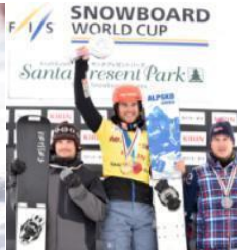
...zuoberst auf dem Podest